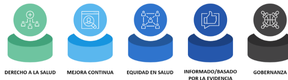
Figura 2. Principios guías del DSPR