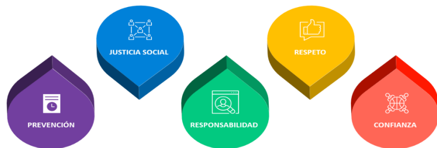
Figura 1. Valores organizacionales del DSPR

Como parte del ejercicio de definición de los nuevos lineamientos filosóficos que dirigirán la gestión del DSPR a futuro, se definieron una serie de valores organizacionales y principios guías sobre los cuales deberán descansar las actuaciones de la Agencia. Primeramente, se definieron los cinco valores organizacionales que deberá fundamentar el accionar institucional: Prevención, Justicia Social, Responsabilidad, Confianza y Respeto. Acto seguido, se establecieron los cinco principios guías que dirigirán el camino a seguir para las referidas acciones: el Derecho a la Salud, Mejora Continua, Equidad en Salud, Informado/Basado por la Evidencia, Gobernanza y Esfuerzos Informados por la Evidencia. Las Figuras 1 y 2 presentan gráficamente los discutidos lineamientos.